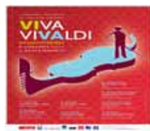
1 Tournée 8 concerts / 8 départements