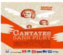
7 Cantates sans filet 2010-2011

Ensuite PASSE TON BACH D'ABORD ! , créé en juin 2008, est un nouveau festival décoiffant : deux jours autour de la musique de Bach, un déferlement d'événements dans des lieux inattendus, insolites et patrimoniaux de Toulouse, au cours desquels la musique baroque est déclinée en version jazz, cirque, flamenco, slam... et aussi baroque ! Un événement à la portée des mélomanes et des curieux, toutes générations confondues, et un succès public impressionnant !