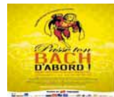
Passé ton BACH d'abord ! 4 et 5 juin 2011