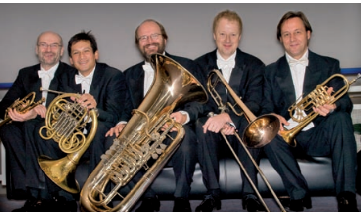
Blechbläserquintett der Bamberger Symphoniker

In unregelmäßigen Abständen musiziert der Bachchor gerne seine Kern-Kompetenz: Die Kunst des A-Capella-Singens. Adventsmusik aus verschiedenen Epochen großer und kleinerer Meister steht auf dem Programm. Tauchen Sie ein in die musi-