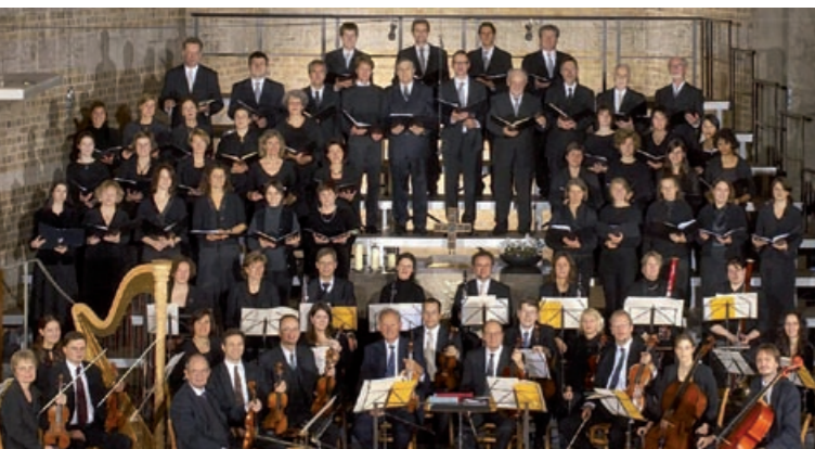
Der Bachchor Würzburg

„Diese Messe ist unsingbar“ sagte der Dirigent, als die geplante Uraufführung platzte. Dass Bruckners große Messe in f-Moll sehr wohl singbar ist, beweist der Siegeszug, den sie seit ihrer Premiere 1872 (vom Komponisten selbst dirigiert)